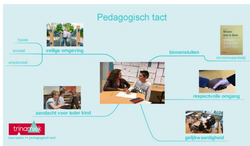
Figuur 2: Pedagogisch tact op WIJ

Bron: Max van Manen, Pedagogische sensitiviteit in de omgang met kinderen